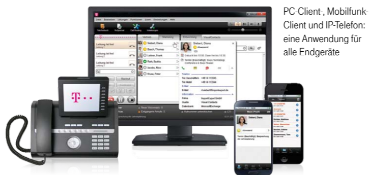
PC-Client, Mobilfunk-Client und IP-Telefon: eine Anwendung für alle Endgeräte

Damit jede Anfrage automatisch beim richtigen Mitarbeiter ankommt, können Rufumleitungen situationsabhängig bestimmt werden. Auch die Einbindung von Datenbanken und das integrierte Sprachdialogsystem tragen ihren Teil dazu bei: Vorgeschaltete Ansagen mit Wahlmöglichkeiten leiten die Anrufer mit jeder Anfrage zum passenden Ansprechpartner. Manuelle Rufumleitungen sind so nicht mehr nötig. Außerdem steht Ihnen die Möglichkeit offen, Gespräche direkt am PC mitzuschneiden – ein wichtiges Instrument zur Qualitätssicherung.