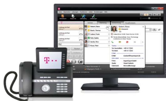
PC-Client und IP-Telefon: eine Anwendung für alle Endgeräte

Der Kunde hat eine Anfrage per E-Mail gestellt? Rufen Sie ihn doch direkt zurück, das ist persönlicher, und eventuell zusätzlich auftretende Fragen lassen sich sofort klären – außerdem kostet es Sie nur einen Klick: Sie können direkt aus dem entsprechenden Kontakt oder der E-Mail-Signatur in Outlook oder Lotus Notes heraus wählen. Es ist im Gespräch noch eine Expertenmeinung gefragt? Kein Problem: Sie schalten den erreichbaren Mitarbeiter der Fachabteilung einfach per Mausclick zur 3er-Konferenz dazu.